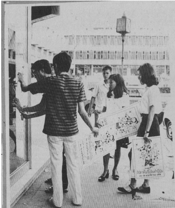
รูปที่ 3 นักศึกษาแจกโปสเตอร์ตามสถานที่ต่างๆ ในกรุงเทพฯ

ที่มา: บางกอกโพสต์ วันที่ 13 พฤศจิกายน 2515, หน้า 5.