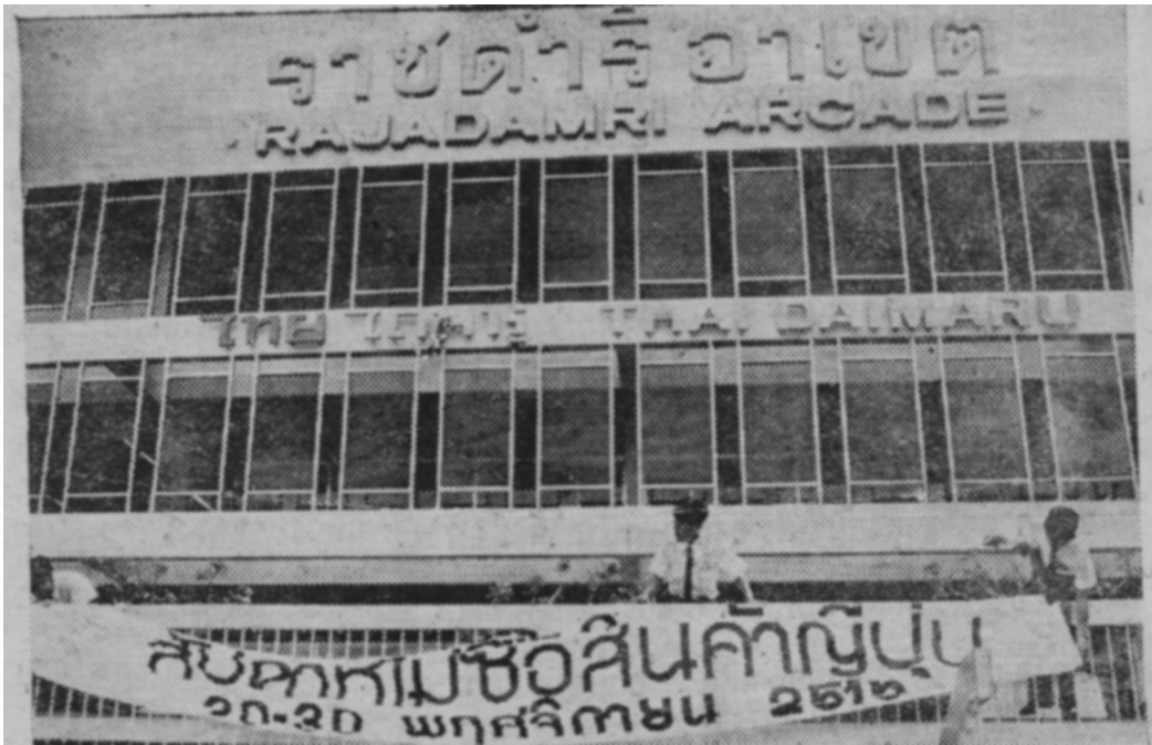
รูปที่ 6 นักศึกษานำแผ่นผ้าไปปิดหน้าห้างสรรพสินค้าไทย ไดมาร์