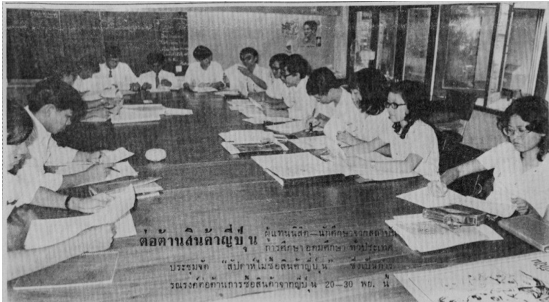
รูปที่ 5 นักศึกษาจากสถาบันต่างๆ ร่วมจัดประชุมวางแผนต่อต้านการซื้อสินค้าจากญี่ปุ่น

แม่น้ำโขงพร้อมกับจะนำเรื่องนี้ไปประชาสัมพันธ์บอก ต่อแก่ผู้ปกครอง ญาติพี่น้อง คนรู้จักเพื่อไม่ให้ซื้อ สินค้าญี่ปุ่นในช่วงวันที่ 20-30 พฤศจิกายน ด้วย 42