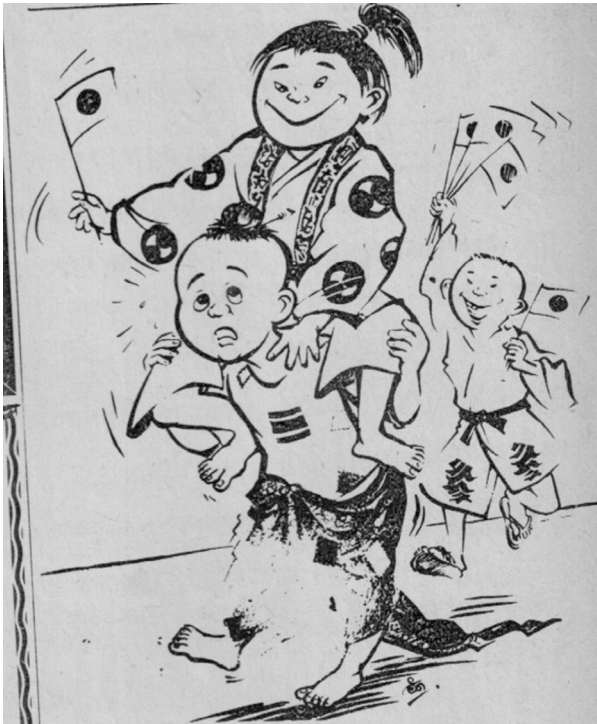
รูปที่ 1 โปสเตอร์รณรงค์การต่อต้านสินค้าญี่ปุ่น