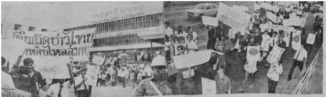
รูปที่ 7 นักศึกษาถือแผ่นป้ายประท้วงไปตามย่านการค้าต่างๆ ในกรุงเทพฯ

ทางญี่ปุ่นได้ส่งคณะผู้แทนมาสำรวจข้อเท็จจริงยังภูมิภาคเอเชียอาคเนย์ ชื่อว่า “กันไซเกอิโก” จำนวน 19 คนมายังฟิลิปปินส์ ฮองกง ไทย และอินโดนีเซีย เพื่อหาข้อเท็จจริงเกี่ยวกับการต่อต้าน