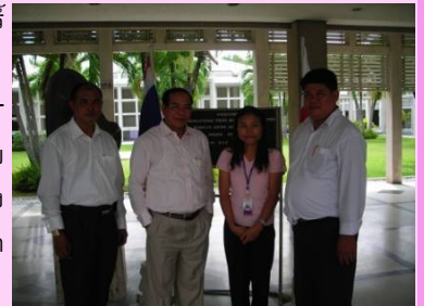
โครงการส่งเสริมการลงทุนใน CLMV ต้อนรับนักธุรกิจชาวกัมพูชาในวันที่ 19 พฤษภาคม 2552